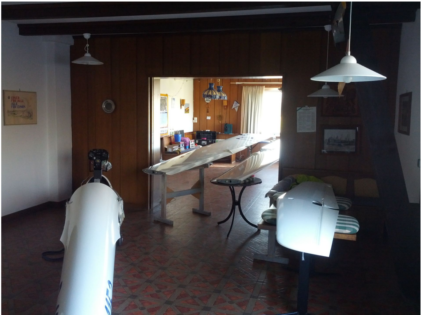
— Die LS8 in ihren Einzelteilen: Rumpf, Tragflächen und Höhenleitwerk

Los ging es zwischen den Weihnachtsfeiertagen und Silvester mit der CharliePapa , der LS8 des Vereins. Danach war die LimaIndia , unsere LS4, an der Reihe. Bei beiden Flugzeugen wurde fleißig geschrubbt und poliert, die LS8 bekam zusätzlich eine kleine Neuerung im Cockpit, und die LS4 einen Satz neue Gurte.