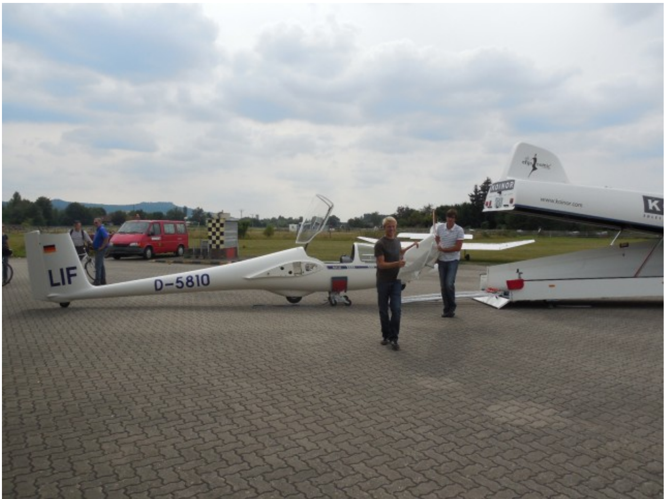
_ 2. Flugzeug unsere doppelsitziger Trainer - bei der ASK 21 ist alles etwas größer...