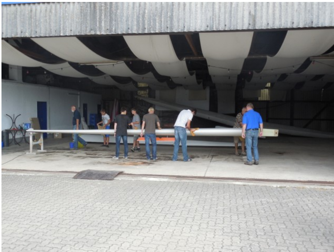
_ Vor dem Aufrüsten der ASK21 wurde sie noch einmal gründlich poliert und gereinigt.